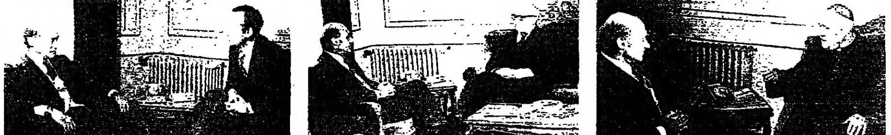
الوزير بطرس مع السفير السوفياتي